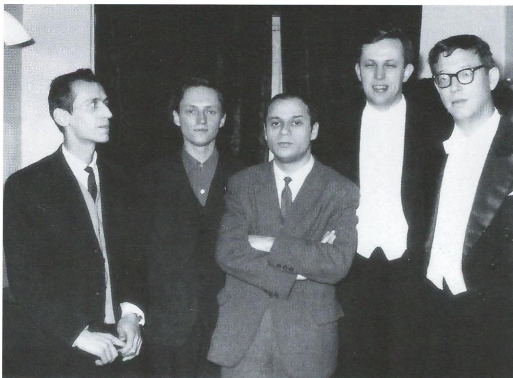
Иллюстрация 7. Слева направо: Валентин Сильвестров, Леонид Грабовский, Виталий Годзяцкий, Игорь Блажков и Андрей Волконский. После исполнения «Сюиты зеркал». 9 января 1967 года.

полезных для профессиональных нужд: «Дорогой Игорь Иванович! Вы всегда очень трогаете меня Вашим вниманием. Я очень благодарен Вам за “Хроники” Стравинского, в Москве их пока еще нет и, благодаря Вам, я один из счастливых москвичей» (цит. по: [2, 244]).