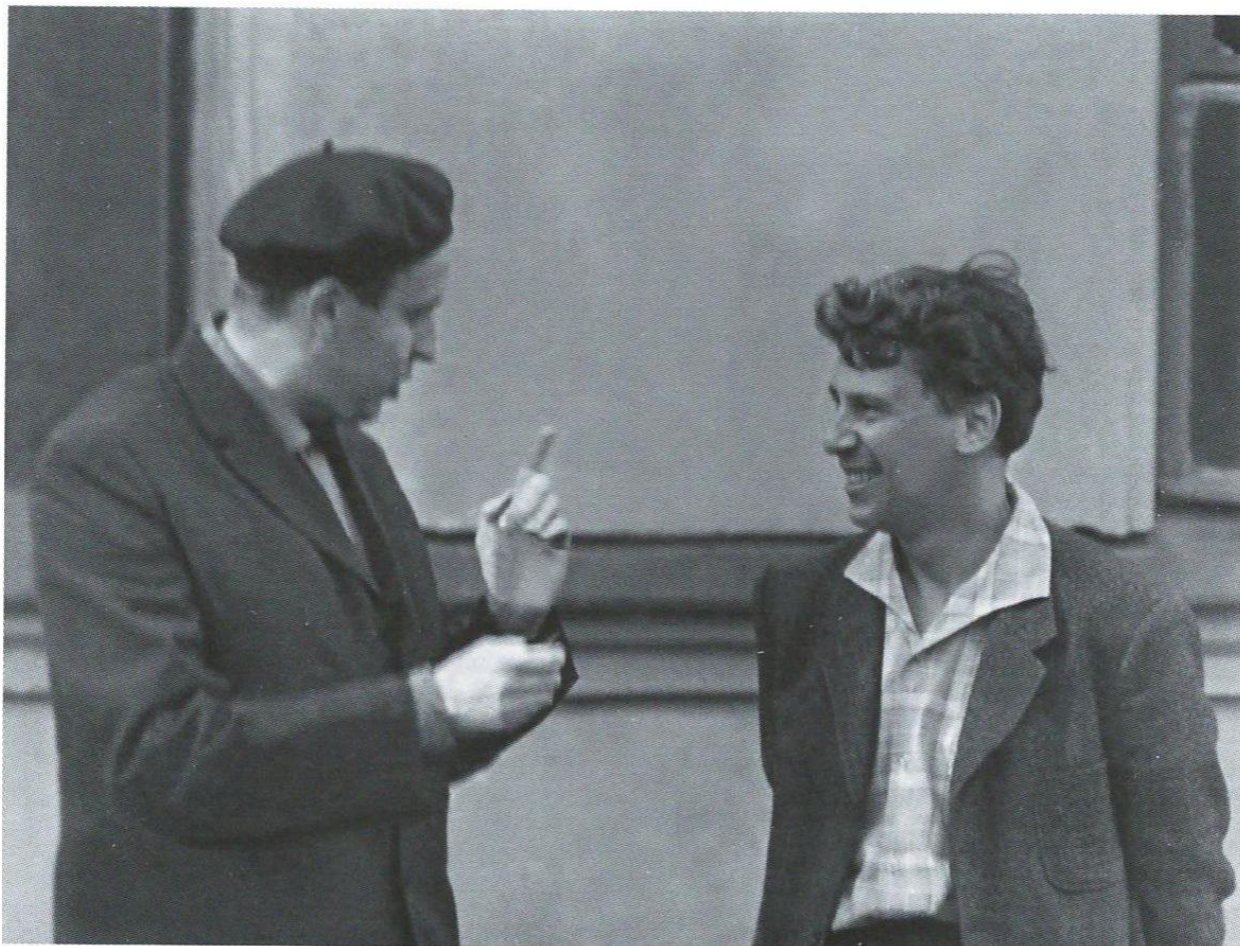
Иллюстрация 6. Игорь Блажков и Борис Тищенко. Ленинград, 1964 год.

марта 1965 года силами Оперно-симфонического оркестра Всесоюзного радио и телевидения под управлением И. Блажкова, солистом выступил автор. Сам композитор отмечал: «...Фортепианный концерт <...> “впустил” меня в “большую” музыку. <...> Вот с этого момента я стал относительно известным» (цит. по: [13, 7]). Критик М. Бялик отмечает: «...этот опус стал свидетельством зрелости и полной самостоятельности художника. Обнаружить тут следы чьих-либо влияний затруднительно. Целое и детали пребывают в абсолютной гармонии» [9, 3].