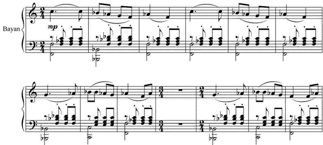
Пример 2. А. Крашенинников. Концерт для саксофона с оркестром. Тема баяна, такты 83–95.