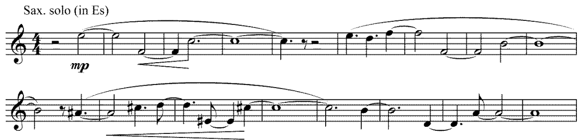
Пример 1. А. Крашенинников. Концерт для саксофона с оркестром. Тема саксофона, такты 64–80.

Тема баяна (Пример 2) контрастна предыдущей теме на нескольких уровнях — стилистическом, образном и интонационно-ритмическом. Крашенинников обратился здесь к заимствованному материалу. Основу темы составила русская народная песня «Ой, мы дерево срубили» 3 . Композитор воспользовался образцом из сборника по сольфеджио Н. Баевой и Т. Зебряк.