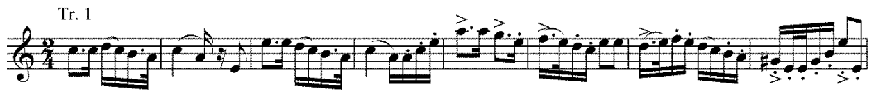
Пример 4. А. Крашенинников. Концерт для саксофона с оркестром, маршевая трансформация народной темы, такты 245–252.

Затем (с ц. [31]) тема вновь претерпевает метаморфозы. На этот раз композитор меняет ее жанровое наклонение, превращая в марш. Тема наделяется пунктирным ритмом, кроме того, вместо второго предложения Крашенинников «вклинивает» в нее новый материал в духе революционных песен (Пример 4).